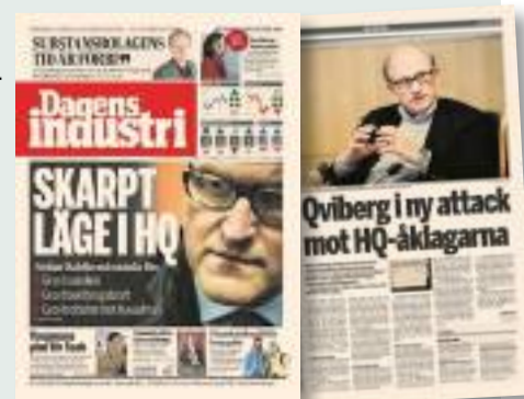
Di den 14 december 2011. Di 28 maj i år.