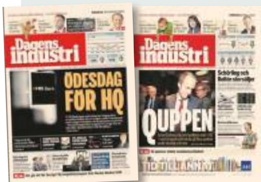
Di den 30 augusti 2010. Di 25 maj 2011.